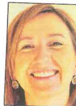
P. D. K.